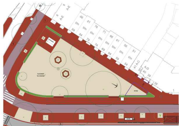
Daan en Daan voorstel terras