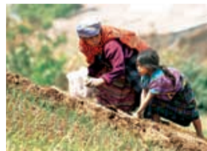
Maya vrouw en kind bewerken het land in Zunil, Guatemala