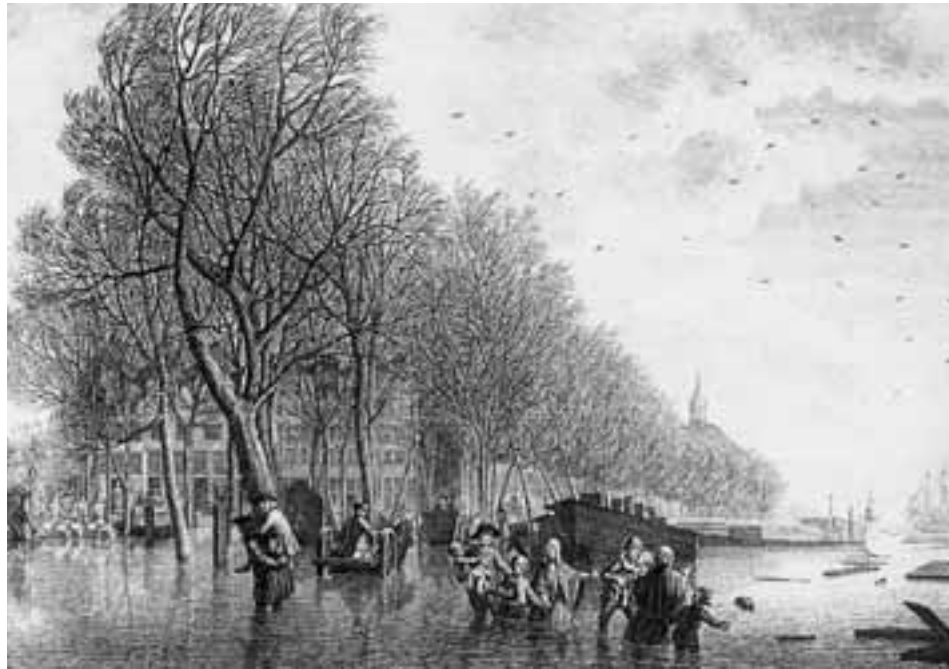
Het Kattenburgerplein bij de grote overstroming van 15 november 1775

se bevolking nog een rijke verscheidenheid aan andere kwalen en ziekten, als koorts, pokken, mazelen en malaria.