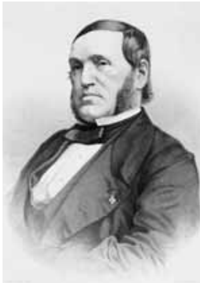
Samuel Sarphati (1813-1866)

De kerk was voor handhaving van de sociale toestand, haar sociale verordening luidde dan ook: armen, verdraagt zon-