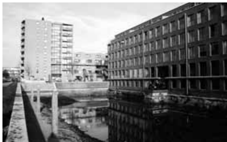
Februari 2005. De net gegraven gracht langs de 2e Wittenburgerdwarstraat. Ongeveer op de plek waar de bezoekers op het steigertje staan, stond ooit het Markerhuisje. De replica moest nog gebouwd worden, maar de trap naar een terras aan het water is al aangelegd.