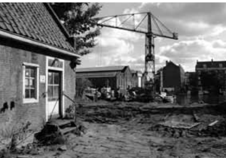
Voorzijde huisje, zelfde tijd, met op de achtergrond de fabriekshallen Werkspoor. Pal langs de voordeur zou de huidige 2e Wittenburgerdwarstraat worden gegraven.