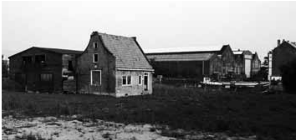
Het huisje in september 2000 vlak voor de afbraak, genomen ongeveer vanaf de huidige plaats van herbouw

Huisje met opstallen eind 1999 genomen ongeveer vanaf de 2e Wittenburgerdwarstraat.