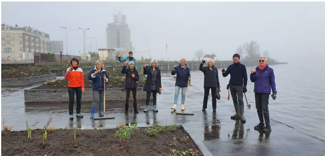
Bewoners Westerdoksdijk maken van een kale kade een tuin

In 2022 is er weer een nieuwe editie van Centrum Begroot. Dit jaar is € 450.000,- beschikbaar voor plannen van bewoners, ondernemers en maatschappelijke organisaties in Amsterdam Centrum om het stadsdeel of de buurt beter en leuker te maken.