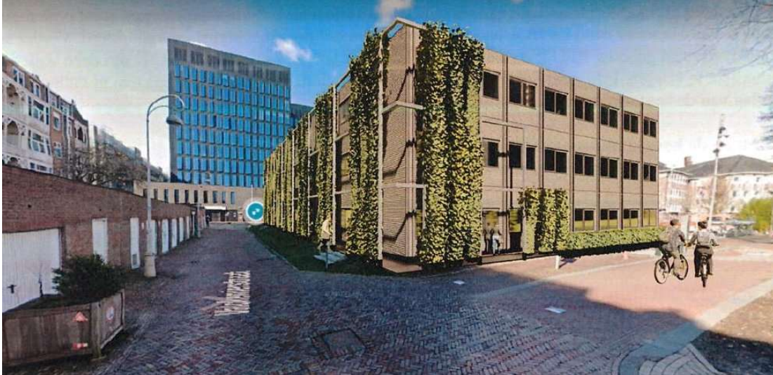
Artist's impression van het extra onderwijsgebouw

Oorzaak voor deze koerswijziging is volgens een persbericht van de UvA tweeledig. Ten eerste is er sprake van een forse groei van het aantal studenten. Ten tweede heeft de coronacrisis duidelijk gemaakt dat er misschien geen behoefte meer is aan de grote onderwijszalen die in het eerdere plan waren voorzien, maar des te meer aan kleine zaaltjes voor het in het digitale tijdperk zo broodnodige fysieke contact tussen studenten en docenten.