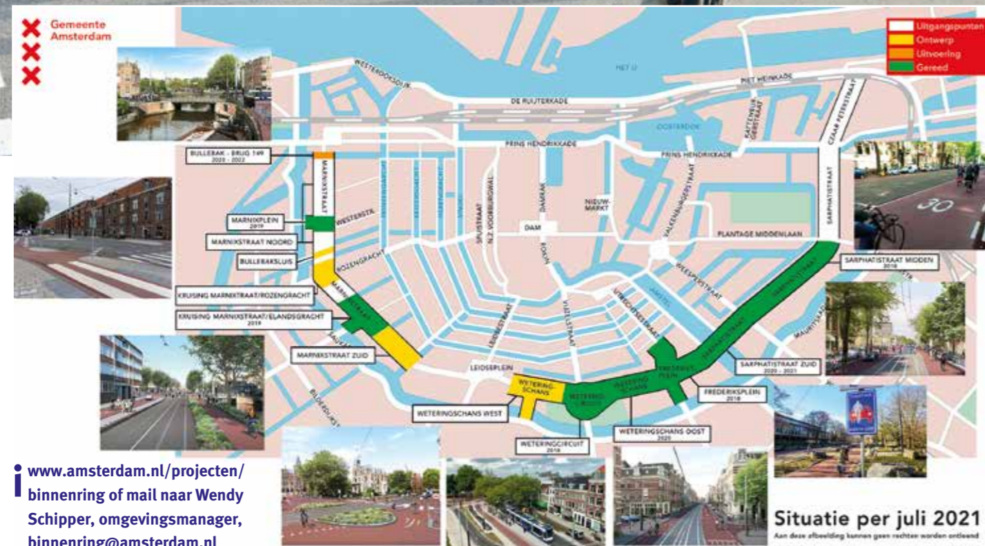
Situatie per juli 2021