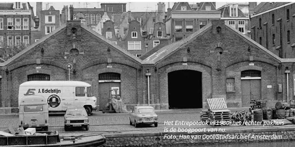
Het Entrepotdok in 1980: het rechter pakhuis is de boogpoort van nu.