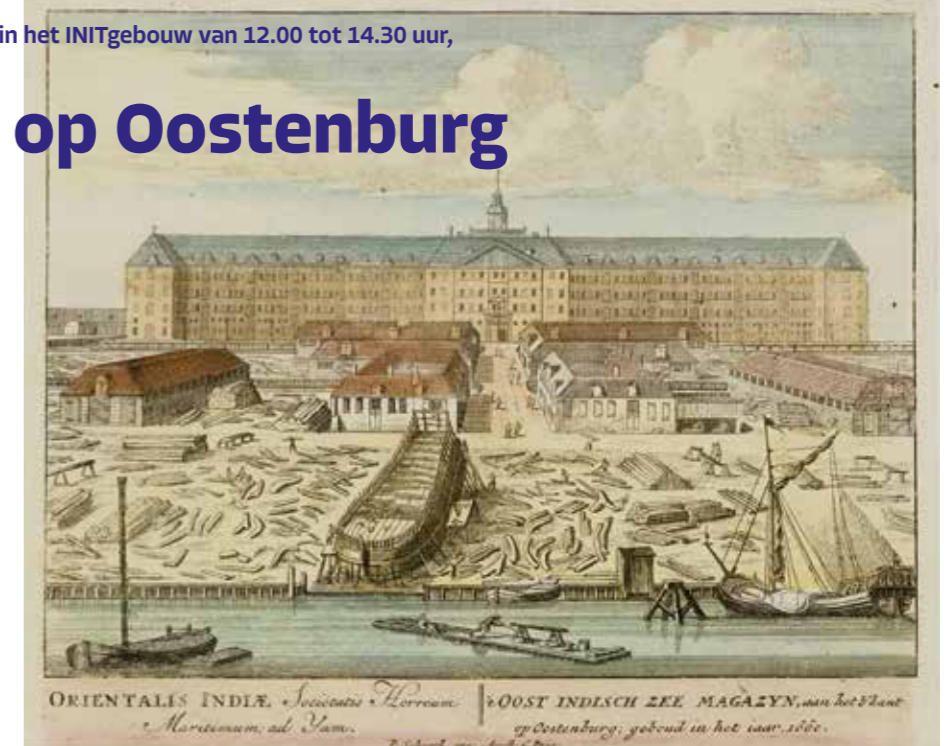
Scheepswerf op Oostenburg, ca. 1710. Prent van Pieter Schenk/Stadsarchief Amsterdam

Op verschillende momenten in haar bijna tweehonderdjarig bestaan bouwde de VOC ook schepen die specifiek bestemd waren voor de handel in mensen, de zogenaamde