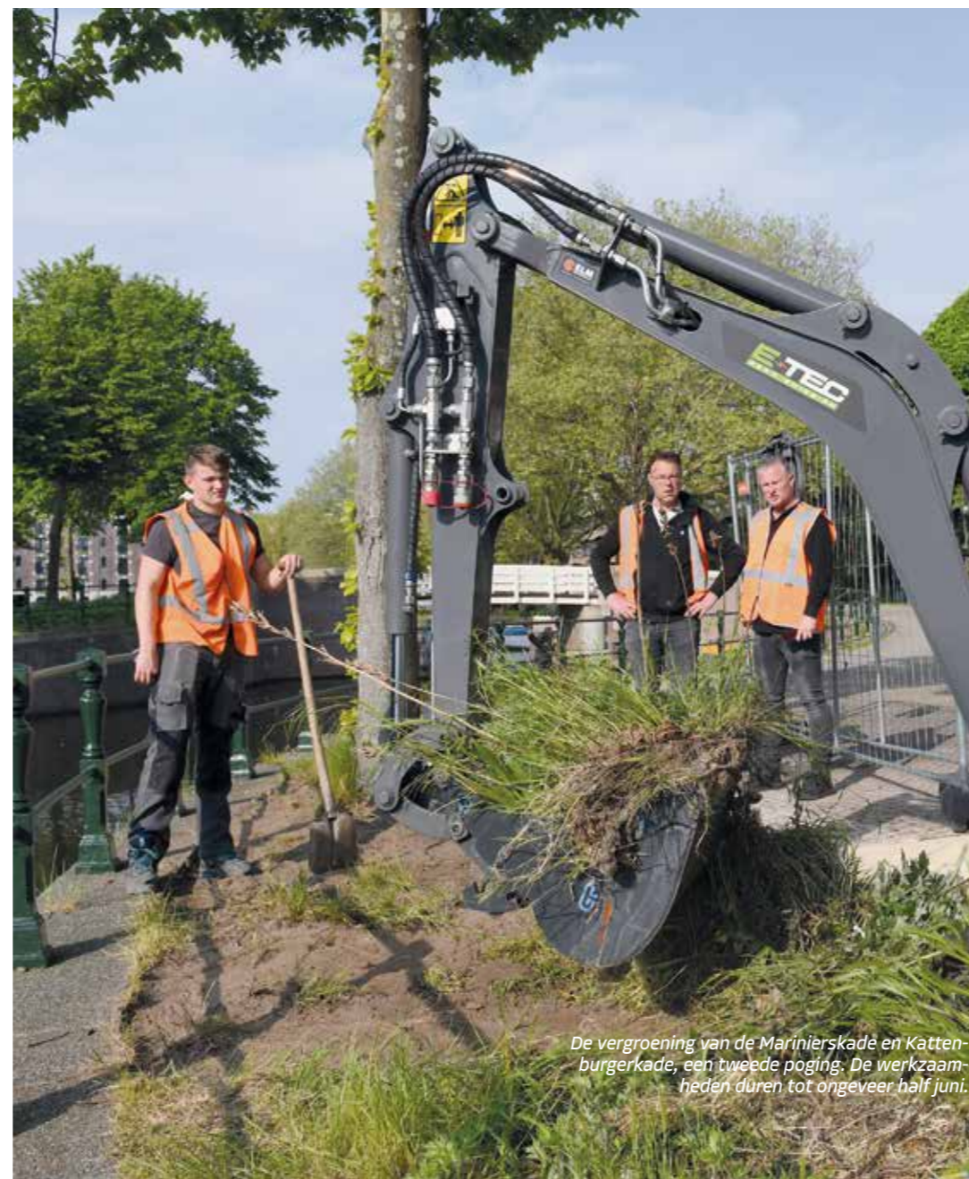
De vergroening van de Marinierskade en Kattenburgerkade, een tweede poging. De werkzaamheden duren tot ongeveer half juni.

waardoor de sporen elkaar kunnen kruisen. ProRail richt vervolgens de vrijgekomen ruimte in als groen gebied. Dit staat opgenomen in het Tracébesluit Programma Hoogfrequent Spoorvervoer (PHS) Amsterdam Centraal en de Ruimtelijke visie Dijkgracht Oost. Het groene gebied is naar verwachting klaar in 2030. We willen graag dat het spoorpark toegankelijk wordt voor iedereen. Omdat dit het laatste onderdeel van het plan is dat wordt uitgevoerd, wordt hier pas over een paar jaar een besluit over genomen. Dit is ook de reden dat hier op een later moment, dicht bij de start van uitvoering, geld voor beschikbaar kan worden gesteld. In de gesprekken hierover, ook met ProRail, nemen we mee dat de behoefte vanuit de buurt voor openbaar groen groot is.