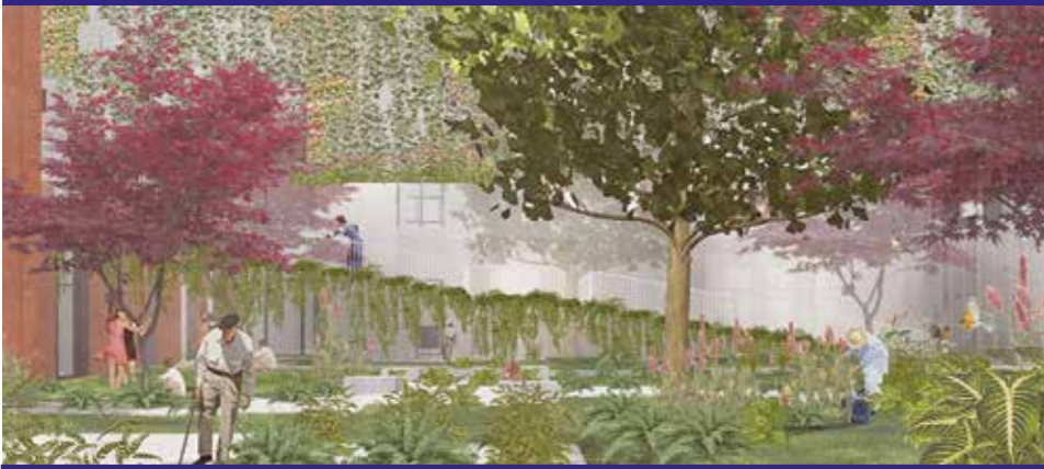
Kavel 6, met woningen voor jongeren én ouderen