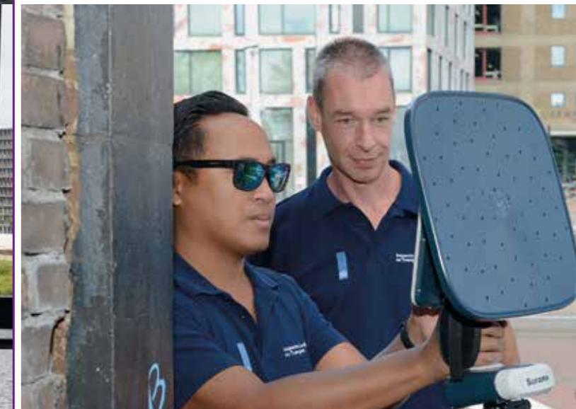
Geluidsmetingen in augustus 2022 door de Inspectie Leefomgeving & Transport

De werkzaamheden vinden plaats naar aanleiding van een onderzoek, waaruit bleek dat het 'door omwonenden als hinderlijk ervaren impulsgeluid' was teruggekeerd. Dit ondanks de herstelwerkzaamheden in 2021 en 2022. Het onderzoek had tot doel om blijvend effectieve maatregelen te vinden.