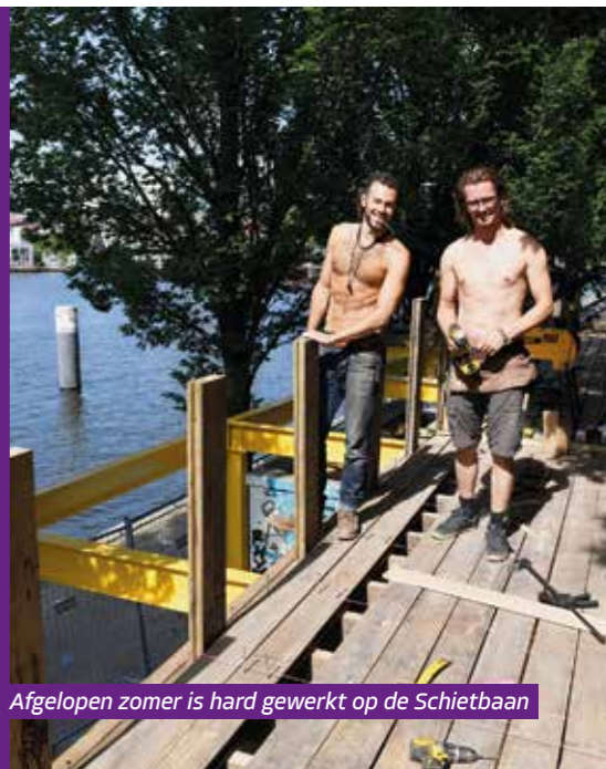
Afgelopen zomer is hard gewerkt op de Schietbaan

Zondag 15 oktober is de derde Groenmarkt op de Voorwerf van het Marineterrein. Die staat in het teken van groen en natuur. Liefhebbers kunnen er inspiratie komen opdoen, workshops volgen, de groene projecten op het Marineterrein ontdekken en nog veel meer.