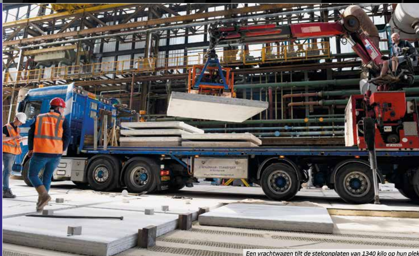
Een vrachtwagen tilt de stelconplaten van 1340 kilo op hun plek

De bodemverontreiniging is als het ware 'ingepakt': onder zit een dichte kleilaag waardoor de olie zit opgesloten; aan de zijkanten houden 4 meter lange stalen damwanden de vervuiling op z'n plek. Van boven is de verontreiniging afgedekt door de oude vloer van de hal; de verontreiniging kan dus geen kant op.