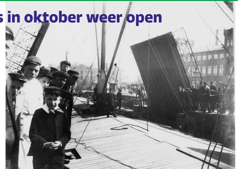
Een zeilschip passeert de Scharrebiersluis omstreeks 1910.

De Scharrebiersluis is volledig gerestaureerd. De stalen brug werd in 1906 gemaakt door de firma Werkspoor. Toen reed er een paardentram overheen tussen het Centraal Station en