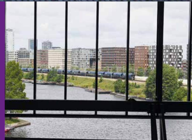
Gezicht op Dijkgracht Oost vanuit de Werkspoorhal

Vandaar het advies van de stadsdeelcommissie om een extra traject te starten in samenwerking met het team Democratisering van de gemeente Amsterdam. Een participatietraject waarbij de gemeente met een aantal bewoners alle relevante informatie, nodig voor goede belangenafweging, gaat vastleggen. Dit participatietraject is inmiddels gestart onder begeleiding van een onafhankelijk procesbegeleider en loopt door tot het eind van 2023. Het extra traject moet leiden tot een inhoudelijk document, dat begin 2024 wordt betrokken bij de besluitvorming over de Dijkgracht Oost.