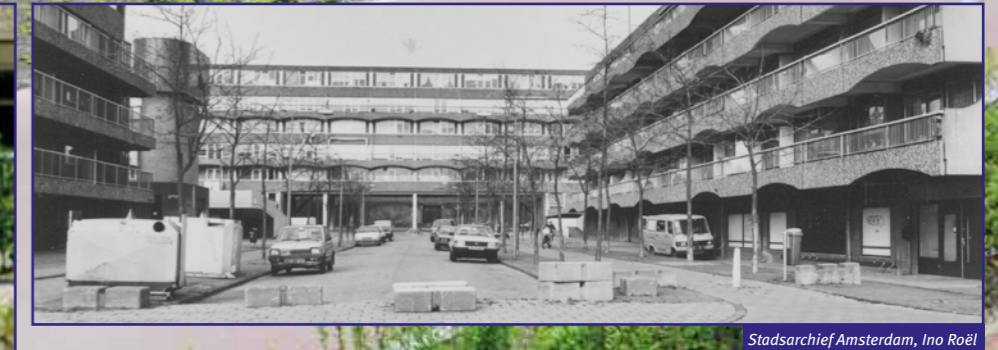
Stadsarchief Amsterdam, Ino Roël