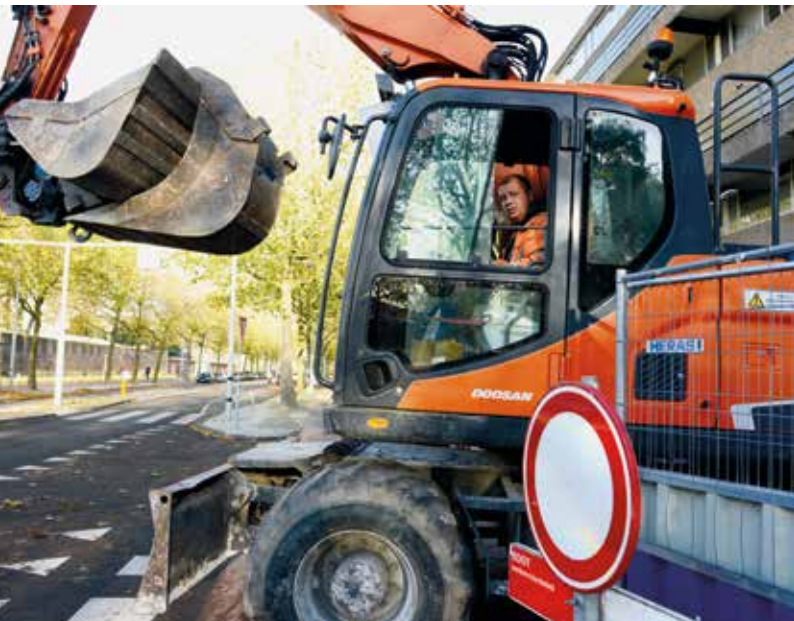
In 2020 vond groot onderhoud plaats op de Kattenburgerstraat.

Woont, werkt, of bent u regelmatig in de buurt van de Oostertoegang, Prins Hendrikkade Oost of de Kattenburgerstraat? Dan kunt u binnenkort uw mening geven over de uitgangspunten voor de nieuwe inrichting van deze straten. De straten worden onder andere opnieuw ingericht om meer ruimte te maken voor fietsers en voetgangers. Dit heeft te maken met de Agenda Amsterdam Autoluw (maatregel 15). De inspraak vindt plaats in het eerste kwartaal van 2021. Meer informatie staat in de Amsterdam Krant, die eind 2020 wordt verspreid. En hou de volgende websites in de gaten voor informatie over de projecten en de mogelijkheden voor inspraak: www.amsterdam.nl/prinshendrikkade www.amsterdam.nl/kattenburgerstraat