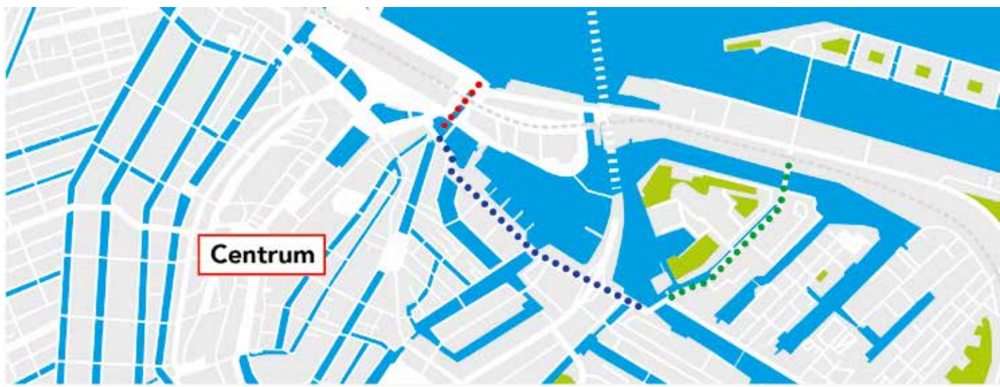
Route in beeld: Oostertoegang (rood), Prins Hendrikkade Oost (blauw), Kattenburgerstraat (groen)