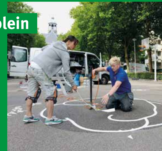
Afgelopen zomer maakte Amsterdam Signpainters een aantal schilderijen op het plein.

Op basis van deze schetsen wil de projectgroep graag met bewoners in gesprek. Hoe en wanneer dat gaat gebeuren, wordt in februari 2021 bekendgemaakt. Heeft u in de tussentijd ideeën over de verbetering van het plein? Neem dan contact op met: