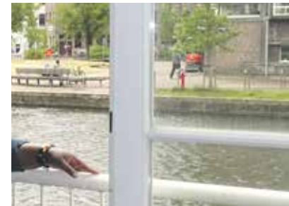
Perspectief voor migranten pagina 4