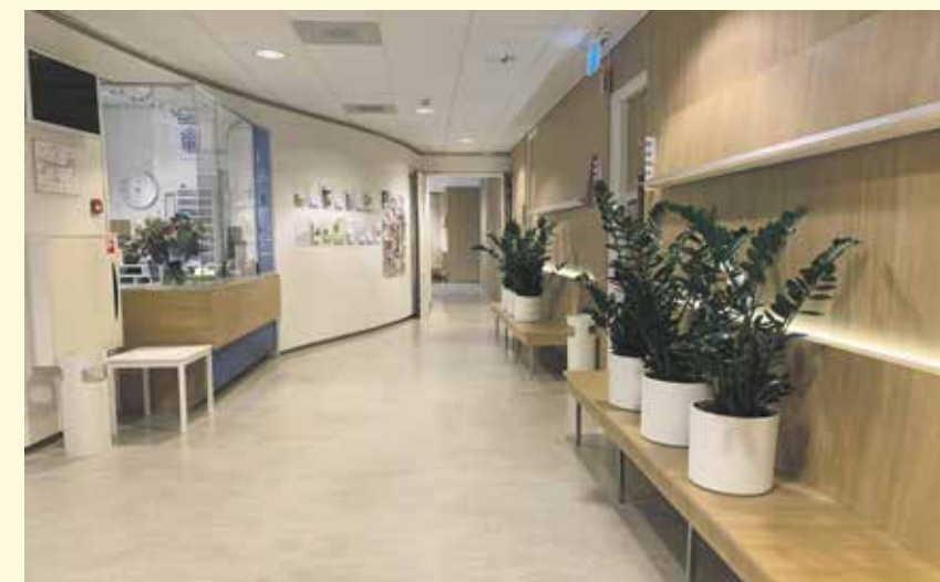
De wachtkamer is coronaproof gemaakt

"De reguliere zorg kan weer worden opgestart, maar daarbij moeten we goed opletten of de achterwacht het aankan. Bij eventuele complicaties moet het OLVG beschikbaar zijn, anders is het onverantwoord. Verder merk ik dat patiënten vinden dat ze hun klachten lang genoeg hebben opgespaard, de rek is er bij hen wat uit. We krijgen ook weer verzoeken voor kleine ingrepen. Toch merk ik dat patiënten nog erg terughoudend zijn en bang om hier besmet te worden. Voor dat laatste hoeven ze echt niet bang te zijn. En mocht er een tweede golf komen, wat ik uiteraard niet hoop, dan zijn we inmiddels goed voorbereid." 🐾