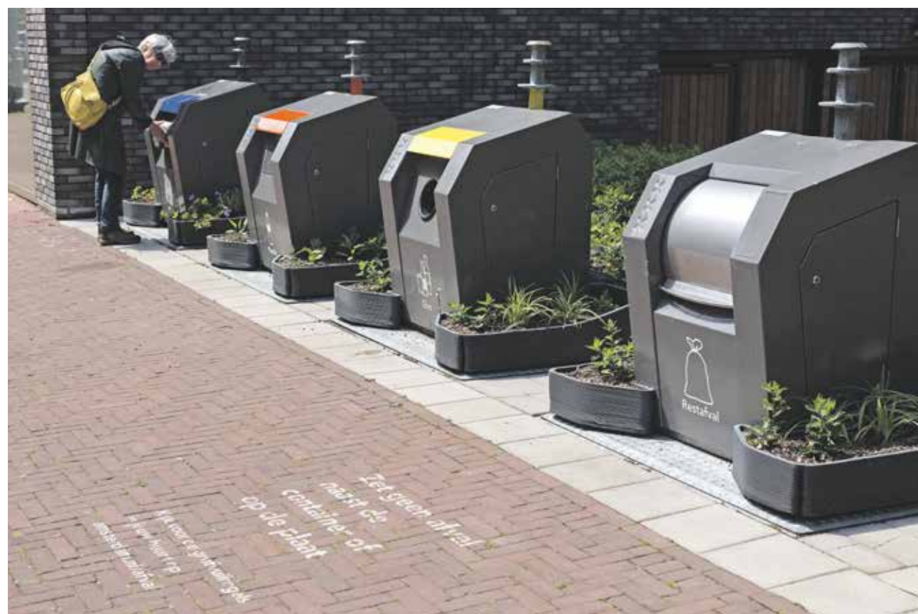
Bewoners aan het Touwbaanpark zijn verantwoordelijk voor de experimentele containertuintjes en vragen de gemeente om een waterpunt

Veel groenprojecten worstelen echter met de wateraanvoer. De initiatiefnemers van de groenvakken hebben om een watertappunt gevraagd. Dat zou volgens de gebiedsbeheerder echter te duur zijn. Zij besloten daarop lange tuinslangen aan te vragen en het water dan maar uit eigen zak te betalen. Ditzelfde doen een aantal Sibbelbewoners in een gemeentelijk parkje aan de Laagte Kadijk. Liters water gingen na aanleg via hun eigen tuinslangen naar de jonge bomen en nog steeds wordt op eigen kosten water gegeven. Een toekomstige zelfbeheerder voor de Kattenburgerkruisstraat vertelde dat zij na lang zoeken een wateraansluiting vond in een werkkast van de corporatie op de begane grond. De VvE, die het plan ondersteunt, gaf toestemming deze te gebruiken. Een lange tuinslang werd