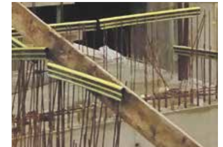
Sint Jacob pagina 22