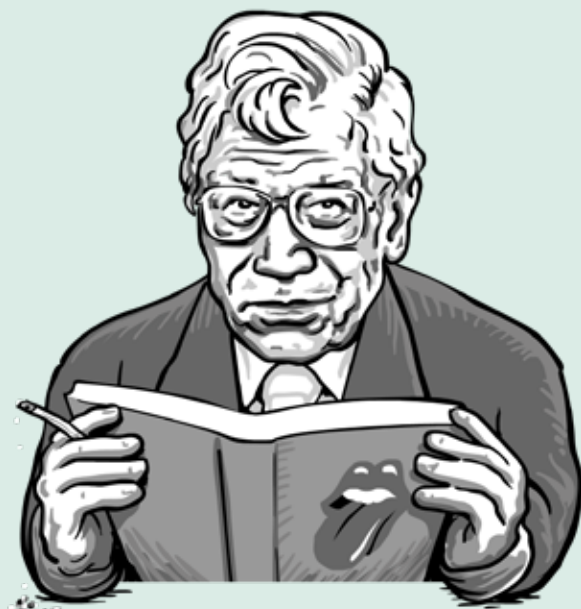
ILLUSTRATIE: ERIK VAN OPHEM

Laat het woord opstarten , dat ooit ten onrechte het Nederlands is binnengevlogen, maar lekker neerstorten. Dat woord is volledig illegaal. Uitzetten, zo snel mogelijk. Ik beloof heilig, op het graf van mijn kat Whisky, dat ik nooit meer op een politicus stem die dat woord in de mond neemt. Zeker niet als die iemand iets over postcode 1018 te zeggen heeft. 🐾